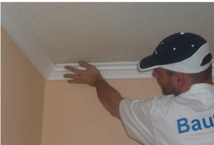
5. NALEPÍME DRUHÚ ČASŤ