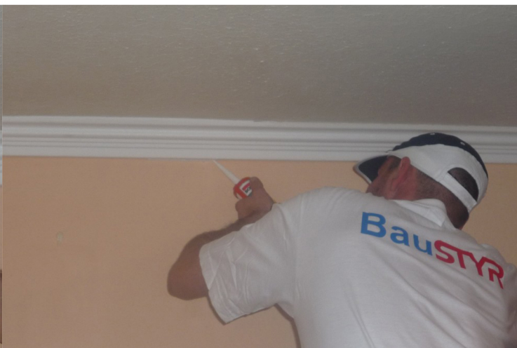
8. VYŠPÁRUJEME PRÍPADNÉ ŠPÁRY