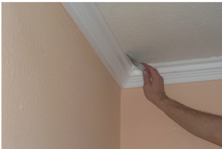
7. VYHLADÍME A ZABRÚSÍME SPOJE