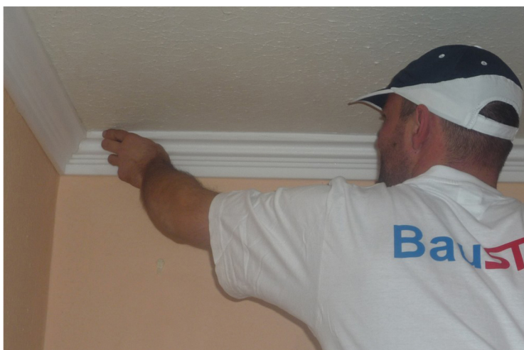
9. ODSTRÁNIME ZBYTOK ŠPÁROVACEJ HMOTY