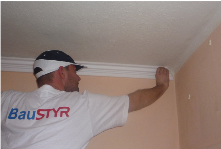
3. NALEPÍME PRVÚ ČASŤ