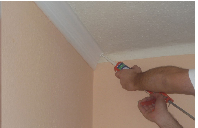
4. LEPIDLO NANESIEME NA SPOJE