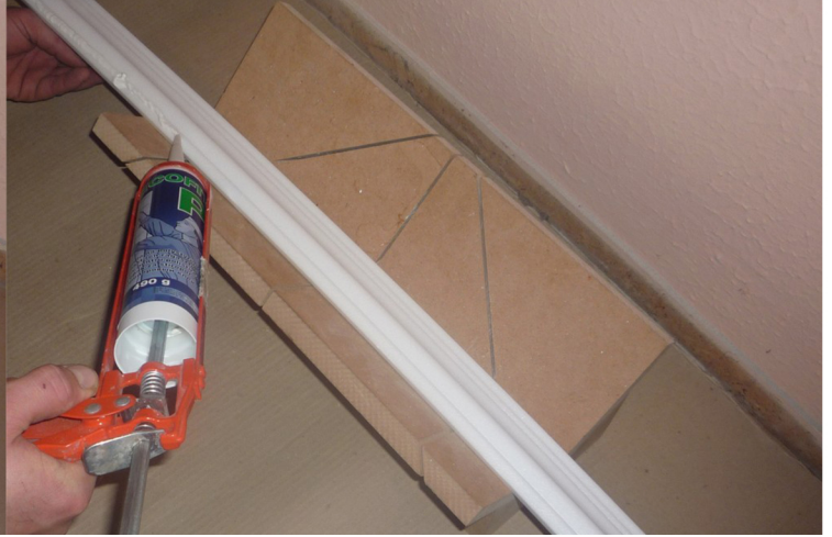
2. LEPIDLO NANESIEME NA LIŠŤU