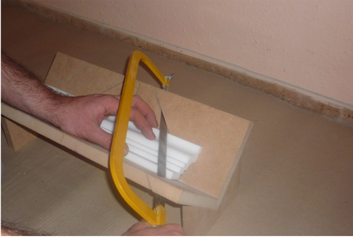
1. LIŠŤU ZREŽEME NA 45°